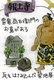
瓦をよみ込んで染地屏が珍しい