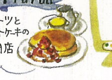
Fru Full フルーツと ホットケーキの 専門店