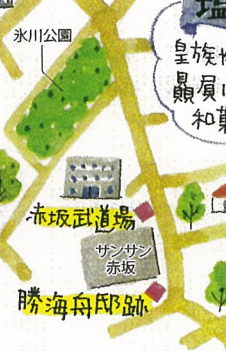
皇族や茶道家に 員ににびて 和菓子店。豆大福が 人気!